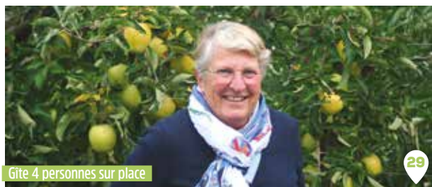
Gîte 4 personnes sur place