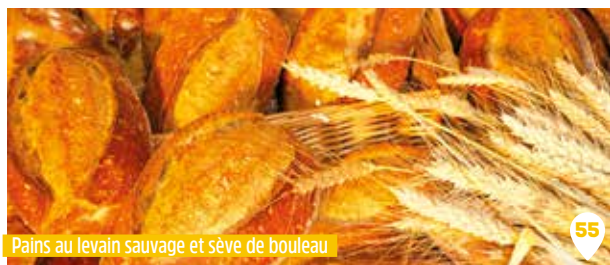
Pains au levain sauvage et sève de bouleau

Les mardi, jeudi et vendredi 13h-16h au lieu dit Launay