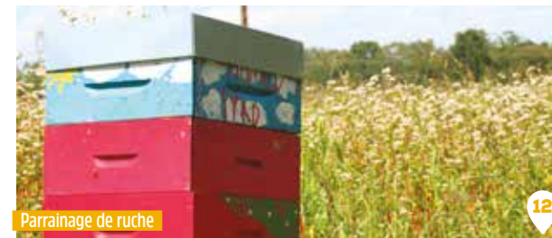
Parrainage de ruche