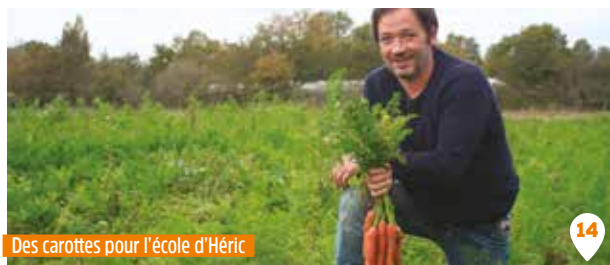
Des carottes pour l'école d'Héric