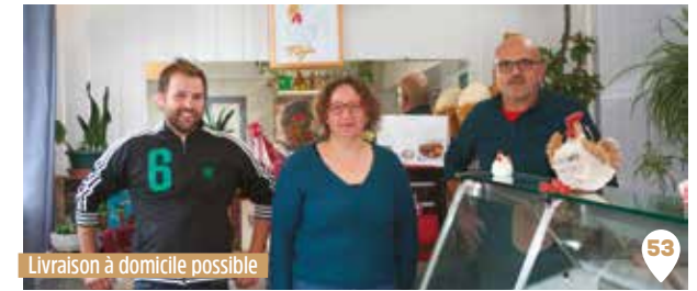
Livraison à domicile possible

Forum des assos Treillières, portes ouvertes de la Bourrie à Casson