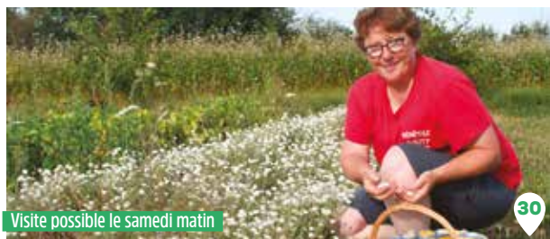
Visite possible le samedi matin

Utilisation de variétés résistantes pour limiter les traitements. Conservation naturelle sans traitement, ni réfrigération après récolte.