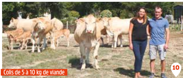
Colis de 5 à 10 kg de viande

Marché fermier de la Brégonnerie à Nort-sur-Erdre et marché de Noël d'Héric