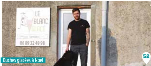
Buches glacées à Noël