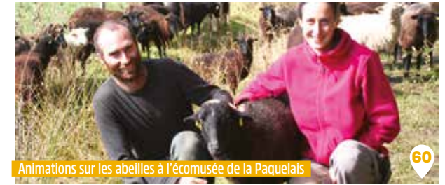
Animations sur les abeilles à l'écomusée de la Paquelais