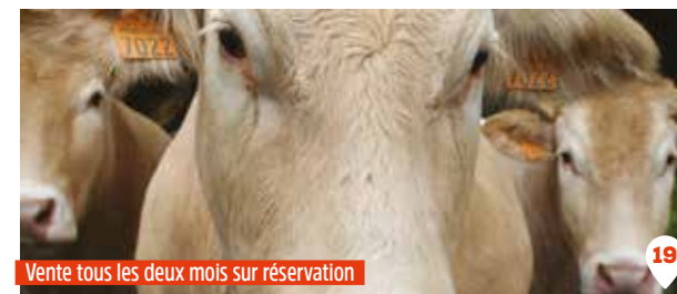
Vente tous les deux mois sur réservation

Vente tous les 2 mois, sur réservation via la page facebook ou par téléphone Retrait le vendredi 16h-19h