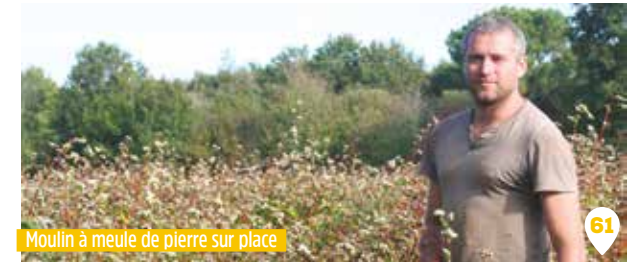
Moulin à meule de pierre sur place