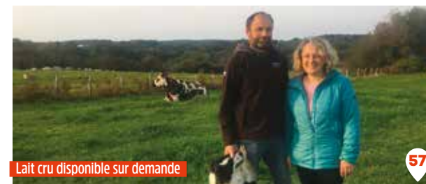
Lait cru disponible sur demande

Vente tous les 2 mois, sur réservation par téléphone ou mail