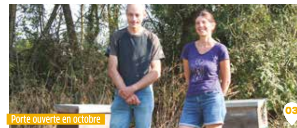
Porte ouverte en octobre