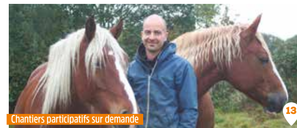
Chantiers participatifs sur demande