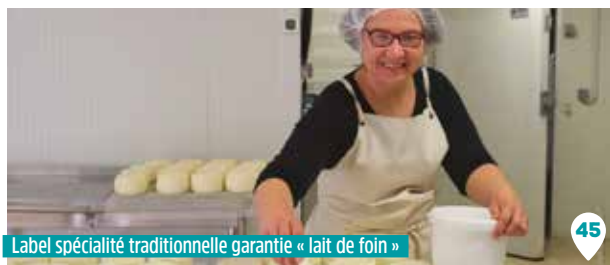
Label spécialité traditionnelle garantie « lait de foin »

Les moutons sont nourris principalement à l'herbe ou avec des céréales produites sur la ferme, garanties sans OGM.