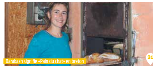
Barakazh signifie «Pain du chat» en breton

AMAP de Nort-sur-Erdre, Héric, Treillières, Sucé-sur-Erdre (Mazerolle et Erdre)