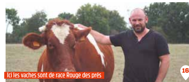
Ici les vaches sont de race Rouge des prés

Touches & Terres, 5 place de la Mairie magasinstouches@gmail.com www.touchesetterres.fr