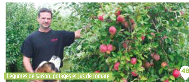
Légumes de saison, potages et jus de tomate