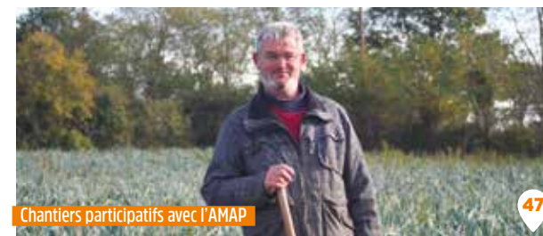
Chantiers participatifs avec l'AMAP

Les fruits et légumes sont traités avec le minimum d'intrants depuis 20 ans.