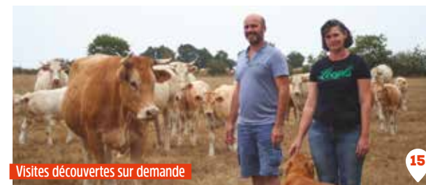
Visites découvertes sur demande

Touches & Terres, 5 place de la Mairie magasinstouches@gmail.com www.touchesetterres.fr