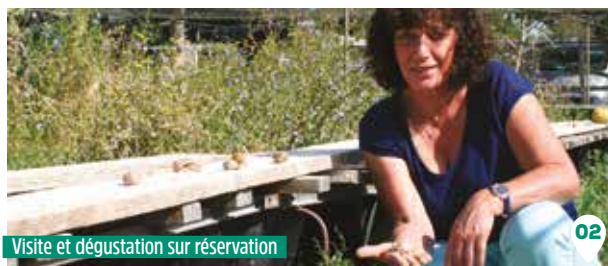
Visite et dégustation sur réservation

Les agneaux sont nourris au lait de leur mère, à l'herbe et aux céréales produites sur l'exploitation.