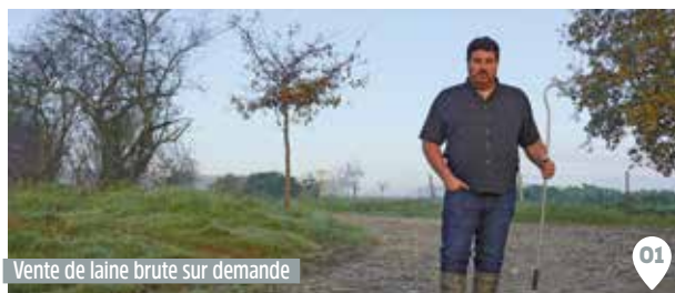
Vente de laine brute sur demande