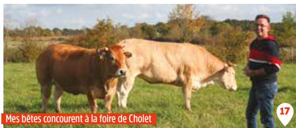
Mes bêtes concourent à la foire de Cholet

Touches & Terres, 5 place de la Mairie magasinlestouches@gmail.com www.touchesetterres.fr