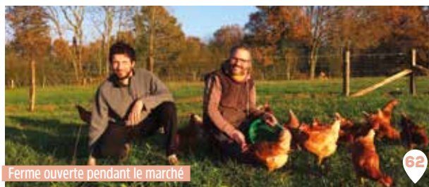
Ferme ouverte pendant le marché