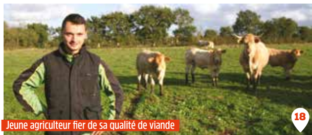
Jeune agriculteur fier de sa qualité de viande

Les vaches sont nourries principalement à l'herbe ou avec des céréales produites sur la ferme. Les canards sont engraisés en respectant la charte «Palmi G Confiance».