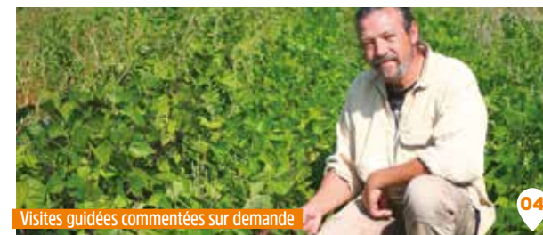
Visites guidées commentées sur demande

Les ruches sont toutes installées le long de l'Erdre, avec de la transhumance pour un tiers d'entre elles dans l'Orléanais et le Maine et Loire.