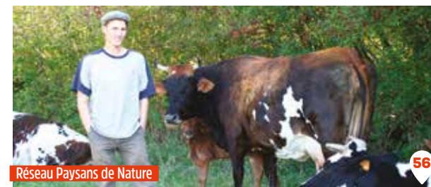
Réseau Paysans de Nature

Vente tous les 2 mois, sur réservation par téléphone ou mail