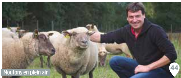
Moutons en plein air