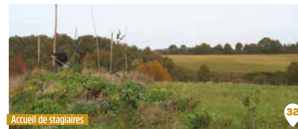
Accueil de stagiaires

Les céréales sont cultivées à proximité du fournil et le pain cuit au four à bois.