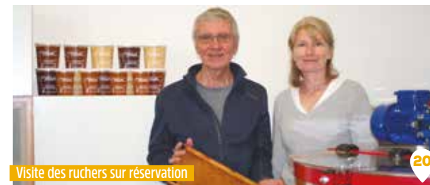
Visite des ruchers sur réservation