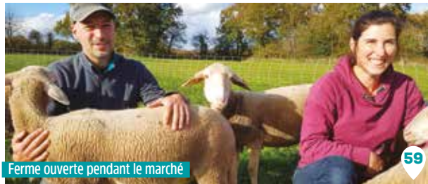
Ferme ouverte pendant le marché

AMAP de Vigneux-de-Bretagne, de l'Erdre, de Grandchamp-des- Fontaines