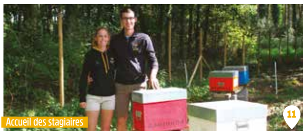
Accueil des stagiaires

Boulangerie «Le pain des landes» et le « Bar des landes » à Notre-Dame-des Landes, La Cave des Saveurs à Héric