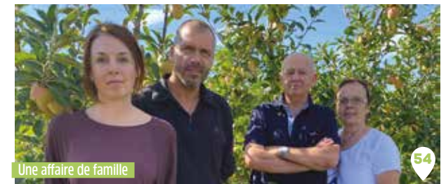
Une affaire de famille

Magasins de producteurs et supermarchés alentours