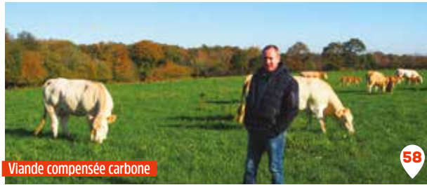
Viande compensée carbone